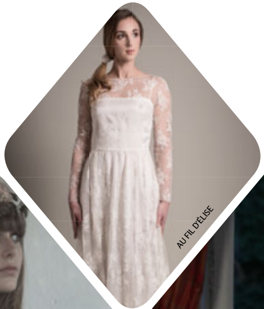
AU FIL D'ELISE