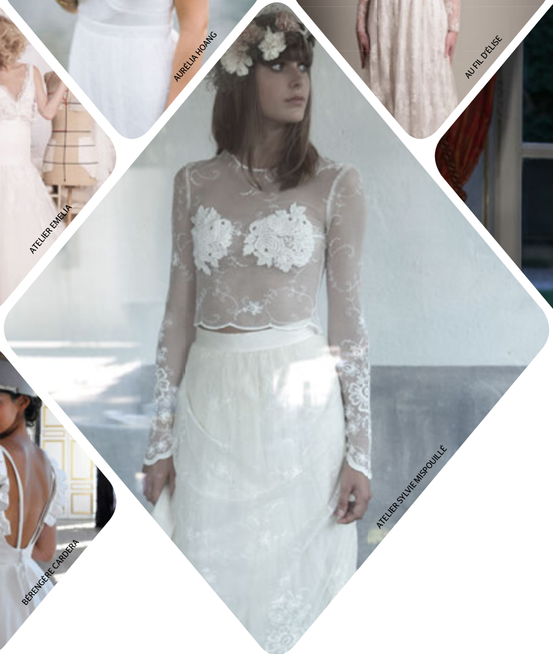
ATELIER SYLVIE MISPOUILLE